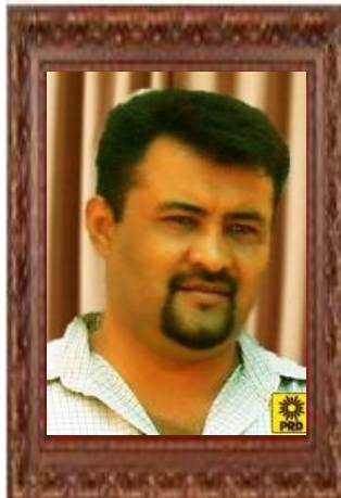
FRANCISCO JAVIER NAVA MIER REGIDOR DE DESARROLLO RURAL